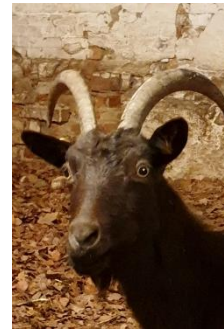
Blacki Methusalem , Urgestein und Dienstälteste des Ziegenhofs, seit 2007 ununterbrochen im Auftrag des guten Ziegenkäses im Einsatz

F: Lotta, Blacki, für uns Menschen stand das Jahr 2020 im Schatten der Coronapandemie, wie ist es euch Ziegen ergangen?